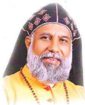
His Beatitude Baselios Cardinal Cleemis Major Archbishop - Catholicos Patron, Mar Gregorios College of Law